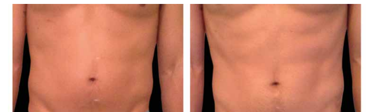
Après la 4e séance / After 4th treatment

start the diet and exercise they need. At the same time, everyone who has used EMSCULPT so far appreciates the improvement they get in their posture, as their abdominal wall is strengthened thus releasing tension on the back muscles.