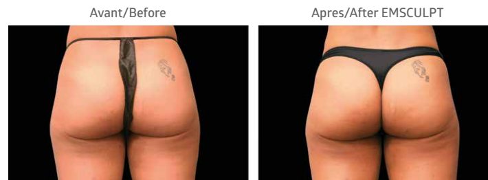
Avant/Before Apres/After EMSCULPT Après la 4e séance / After 4th treatment