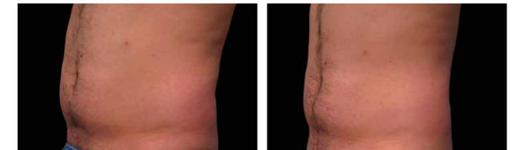
Après la 4e séance / After 4th treatment